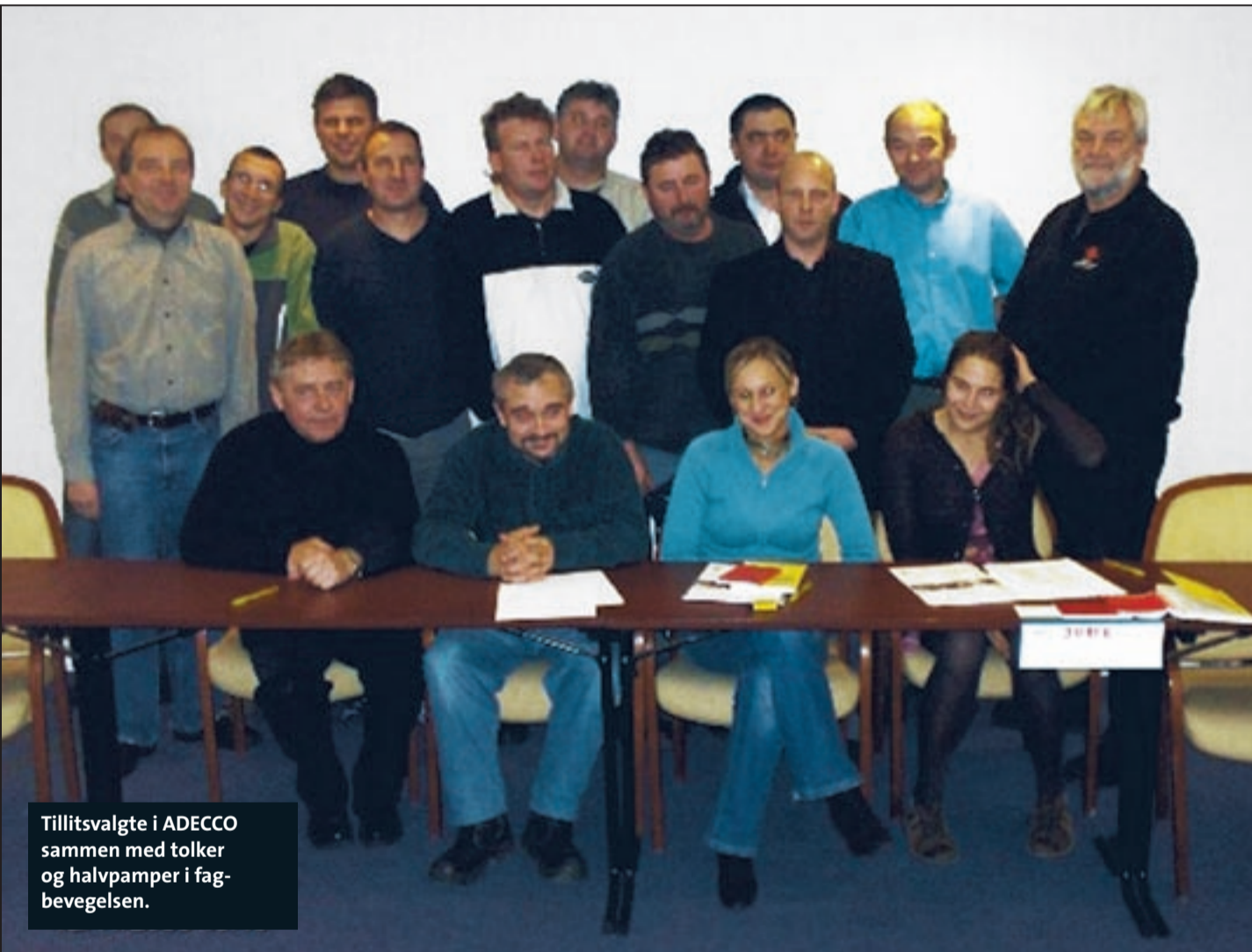
Tillitsvalgte i ADECCO sammen med tolker og halvpamper i fagbevegelsen.

I en hektisk novembermåned var foreningen involvert i mye kursvirksomhet. Et av dem var samlingen av polske tillitsvalgte fra ADECCO i Bergen. Totalt var rundt 20 tillitsvalgte med fra Bergen, Oslo, Stavanger og Tønsberg.