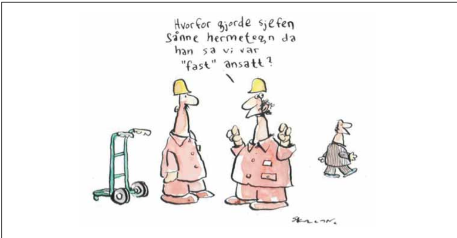
Tegningen er gjengitt med tillatelse fra Fredrik Skavlan

Harald Berntsen er historiker. Han har skrevet en rekke bøker, bl. a. Norsk Bygningsindustriarbeiderforbunds historie. Han har nylig fullført hotell- og restaurantarbeidernes historie. Harald er i tillegg en ivrig debattant.