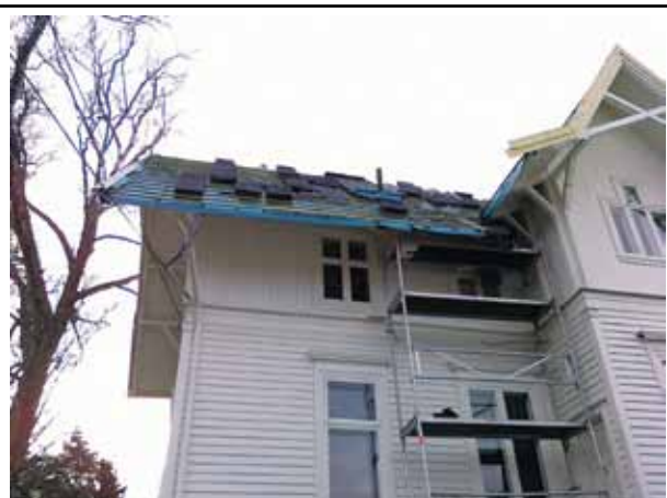
«Et eksempel på godt sikringarbeid ved takarbeid.»